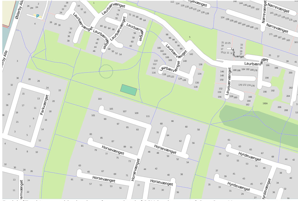
En del af Tranbjerg, som blev kortlagt på en weekend af OSM-kortlæggere, på OpenStreetMap.org.

Hvorfor OpenStreetMap? OpenStreetMap-projektet startede i 2004 for at samle data til et kort, som alle må benytte uden begrænsninger. I en folder som denne kan man f.eks. ikke bruge kommercielle kortdata uden særtilladelse. Frie kortdata gør, at folk kan bruge dem til nye kreative kort, f.eks. et kort som opencyclemap.org for cyklister, eller openpistemap.org for skiløbere. Du kan f.eks. lægge OSM-dataene på din GPS-navigatør, eller se kortene på hjemmesiden. Alle kan være med til at arbejde videre med projektet. Du kan bidrage med at samle data, rette fejl, skrive software, etc. Kig ind på: wiki.osm.org/wiki/Da:Main_Page