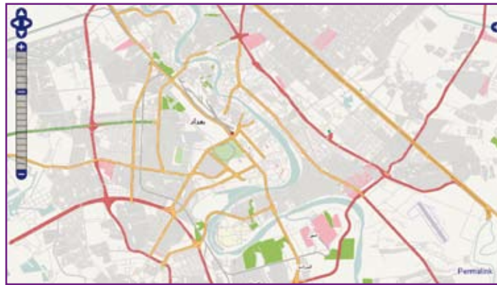
Figure 7 : Bagdad sur OSM, fin mars 2008.

ement par diverses applications et matériels GPS. L'application NAVIT 36 , disponible sous licence GPL, permet de réaliser des calculs d'itinéraires, et de guider un utilisateur par la voix jusqu'à son point d'arrivée. Elle est surtout capable d'utiliser des données OSM, grâce à son convertisseur intégré.