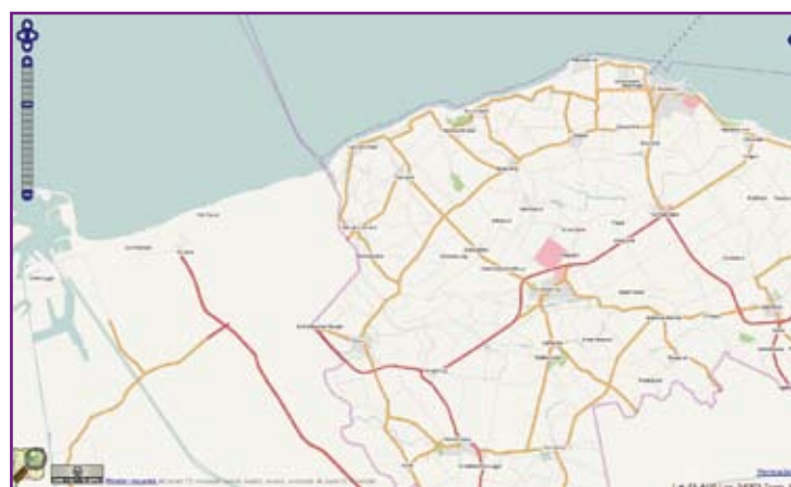
Figure 3 : Extrait de la slippy map (carte dynamique) à la frontière Belgique/Pays Bas 11 , à une dizaine de kilomètres au Nord-Est de Bruges. La frontière est ici matérialisée par la ligne en pointillés violets. La cartographie des Pays-Bas est complète.

Depuis la version 0.5 de l'API, mise en place en septembre 2007 et actuellement en vigueur, les primitives sont au nombre de trois : – les nœuds, constitués d'un identifiant, d'une liste de tags, et de champs latitude et longitude,