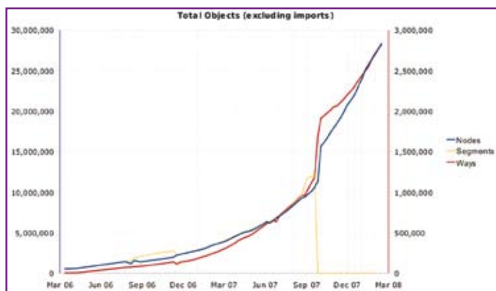
Figure 2 : Croissance du nombre total d'objets en base, sans tenir compte des importations de données externes. On notera la disparition des objets de type « segment » lors du passage à l'API v0.5, au profit des deux autres primitives de données.

Ainsi, un billet du blog OSM en date du 7 janvier 2008 12 révélait que la Fondation se rapprochait d'initiatives telles que Open Data Commons 13 , dont la licence ODCD 14 semblerait plus spéci-