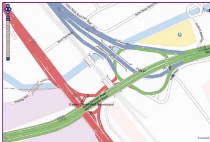
Figure 5 : Échangeur routier de l'autoroute M1 à Londres.

Josm est l'éditeur préféré des contributeurs expérimentés, et le plus complet de tous. C'est aussi le plus ancien éditeur maintenu, puisqu'il a été publié en janvier 2006. Il permet notamment de télécharger un important volume de données GPS brutes, et de travailler en mode hors ligne. Il sait également afficher les photos géoréférencées, ainsi que leur position sur la carte courante : cela est bien pratique pour se souvenir des noms de rues. Enfin, il est capable de gérer les conflits d'édition.