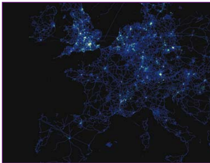
Figure 8 : Densité de points GPS en Europe, début 2008.

Dans le même ordre d'idée, les « Palm Islands » ainsi que la mégastructure « The World » visibles à Dubaï ont été très rapidement cartographiées, bien avant que d'autres fournisseurs de cartes proposent des données les concernant. L'histoire est très similaire pour le nouveau terminal aéroportuaire de Heathrow , cartographié le jour de son ouverture. Force est de constater à quel point la réactivité de la communauté et de l'infrastructure de données spatiales mise en place par OSM est importante.