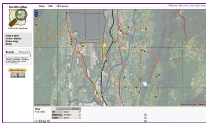
Figure 6 : L'éditeur en ligne potlatch dans lequel un tronçon de la N201 est sélectionné.

peurs du projet sont succinctement résumés par Richard Fairhurst dans une contribution 23 sur la liste Geodata gérée par l'OSGeo : « OSM is essentially an open-source hacker community, albeit the "hackers" are sourced more widely (just as they are in Wikipedia). As such it has two overriding principles: "the simplest thing is good", and "just fricking do it" » . Pour résumer, les slogans s'énoncent ainsi : « la chose la plus simple est la bonne » et « l'action est maîtresse ». De manière générale, il serait difficile de définir un prototype du contributeur OSM : la communauté est aussi diverse que l'on peut imaginer.