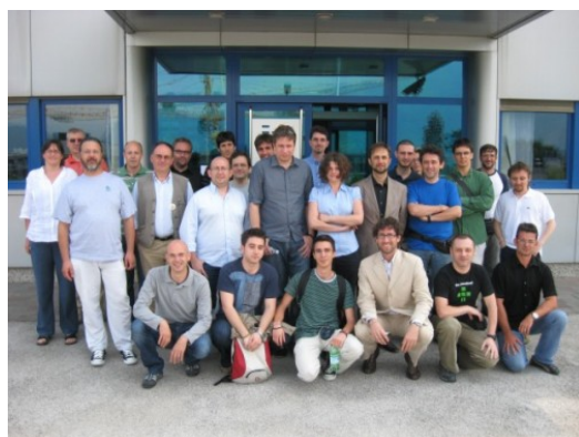
Figura 3: La foto di gruppo di OSMit 2009

I mapping party sono eventi legati a OpenStreetMap , un certo numero di OSMapper, sono così chiamati chi partecipa a OpenStreetMap, sceglie una zona, solitamente poco mappata oppure da completare, incomincia a pubblicizzare l'evento all'interno della comunità e all'esterno contattando enti pubblici, associazioni e media per diffondere la manifestazione, il contatto esterno alla comunità è molto importante per cercare di coinvolgere nuove persone all'interno del progetto.